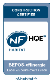
PLAN DE PRECOMMERCIALISATION