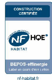
PLAN DE PRECOMMERCIALISATION