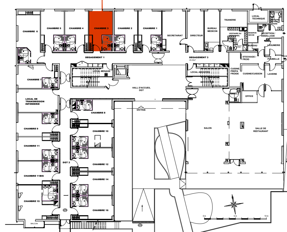
Plan de localisation Rez de chaussée