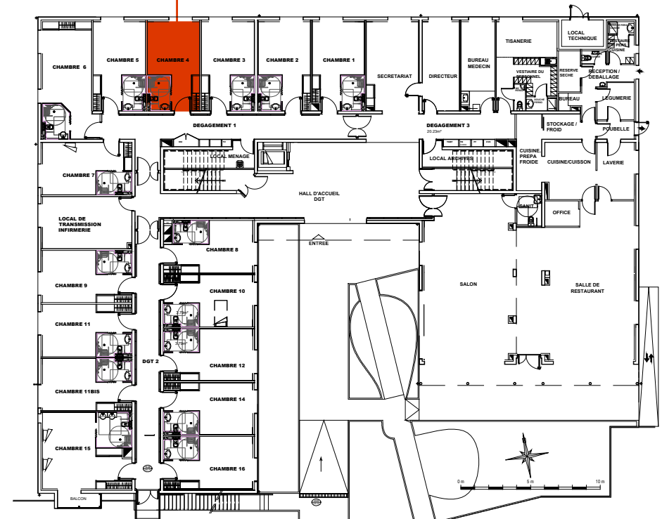
Plan de localisation Rez de chaussée