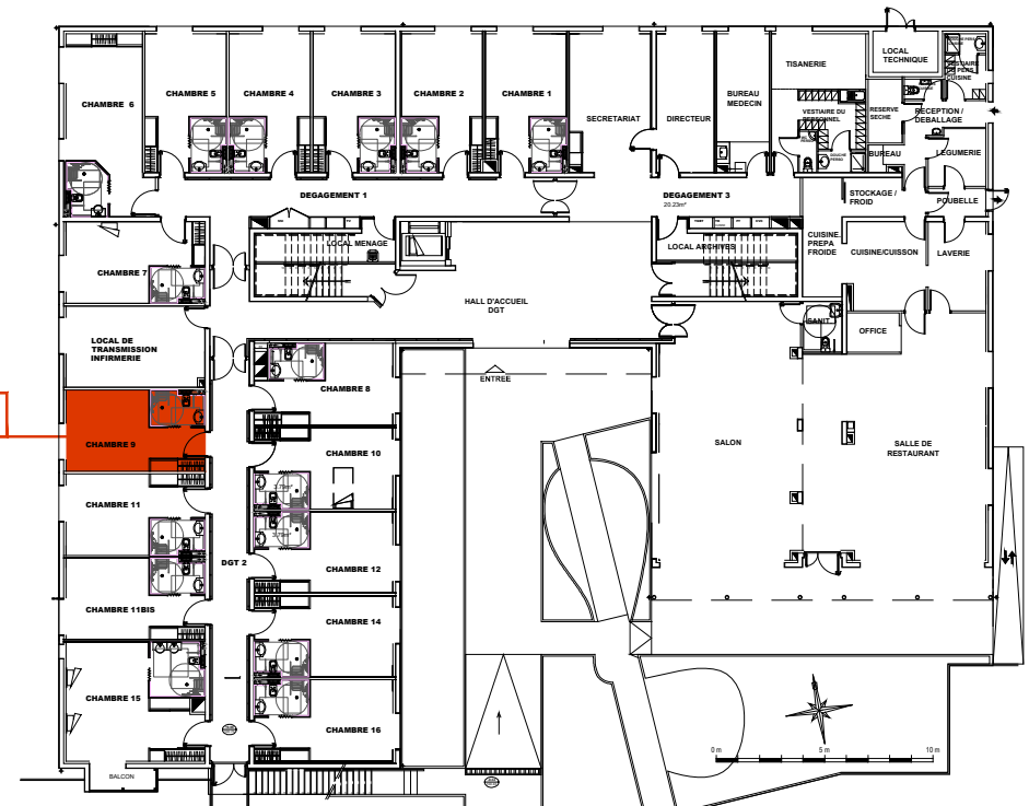
Plan de localisation Rez de chaussée