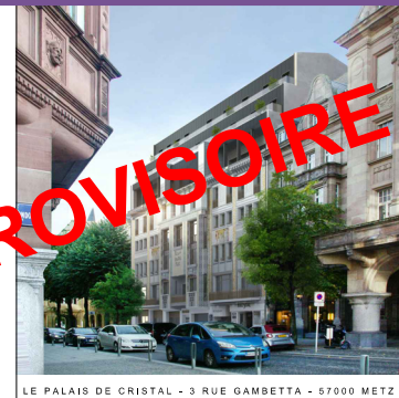
LE PALAIS DE CRISTAL - 3 RUE GAMBETTA - 57000 METZ