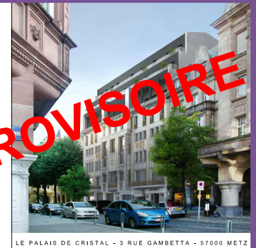
LE PALAIS DE CRISTAL - 3 RUE GAMBETTA - 57000 METZ