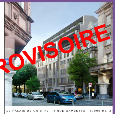
LE PALAIS DE CRISTAL - 3 RUE GAMBETTA - 57000 METZ