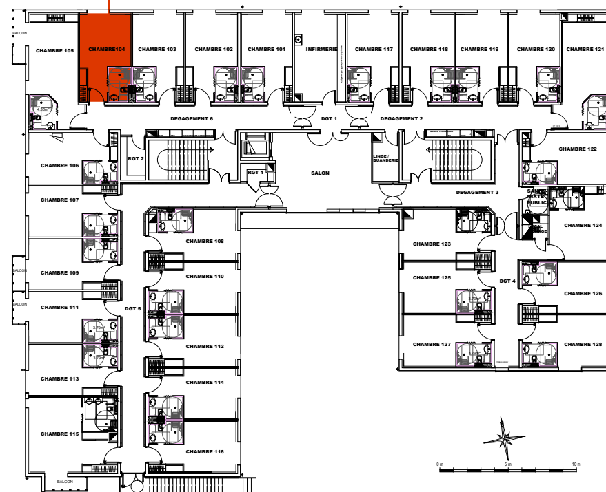
Plan de localisation R+1