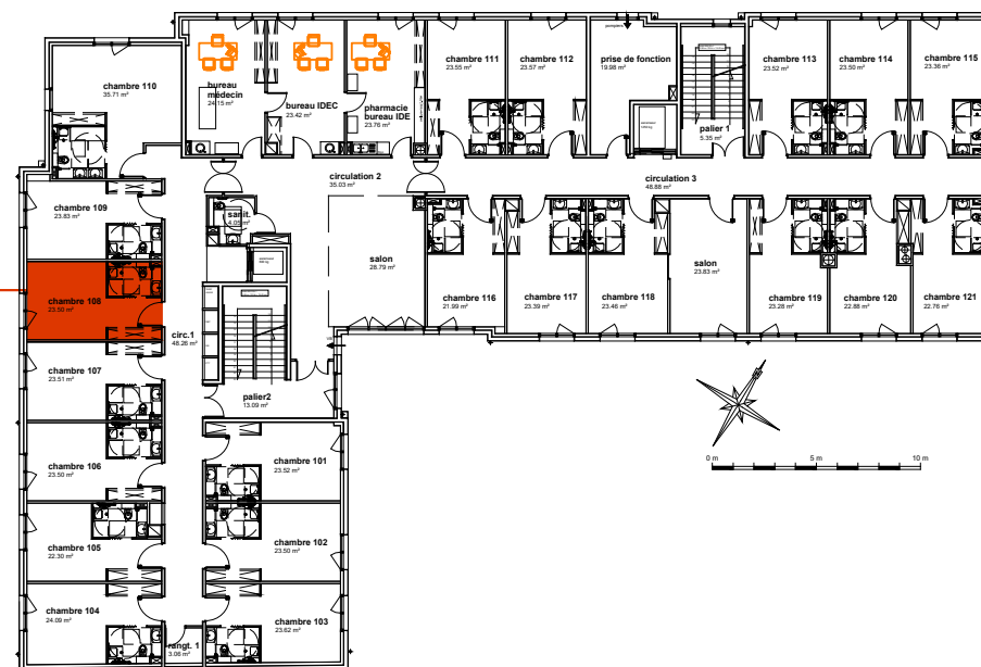
Plan de localisation R+1