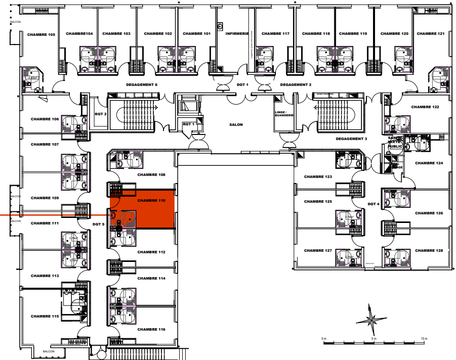
Plan de localisation R+1