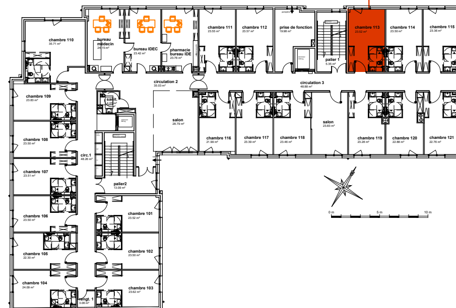
Plan de localisation R+1