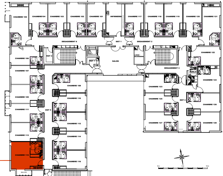
Plan de localisation R+1

SCI ALYSON 128, rue la Boétie 75008 PARIS