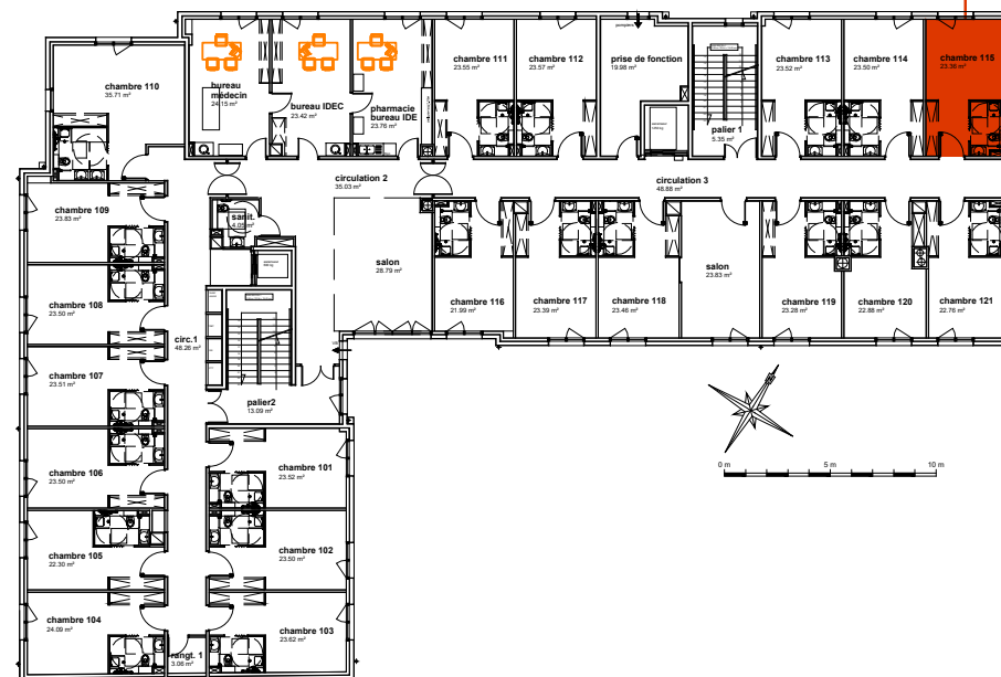
Plan de localisation R+1