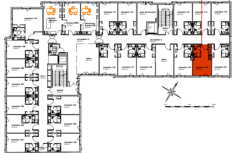
Plan de localisation R+1