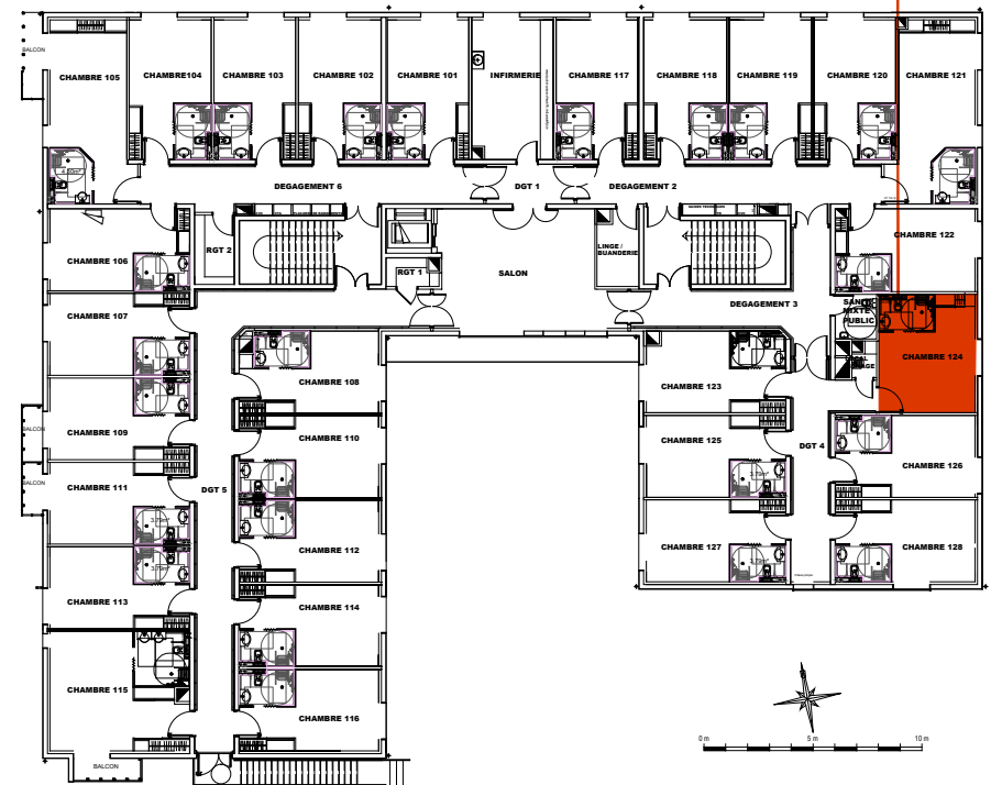
Plan de localisation R+1