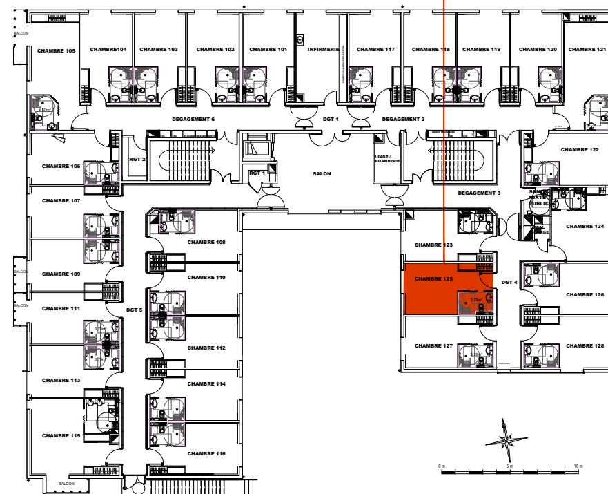
Plan de localisation R+1