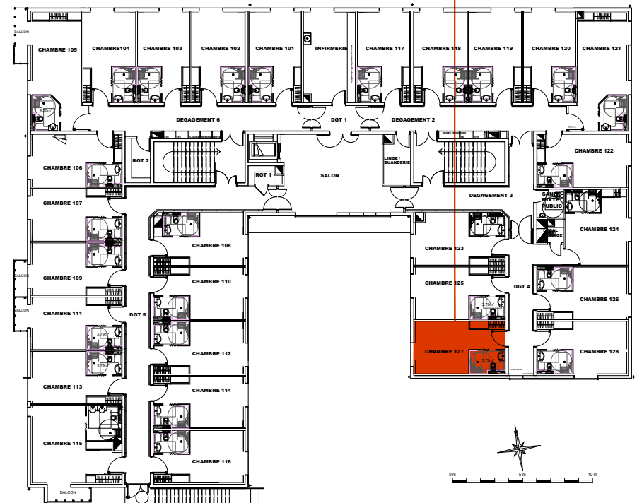
Plan de localisation R+1