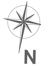
Plan de pré-commercialisation