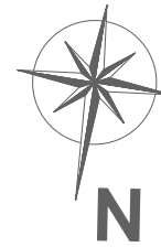
Plan de pré-commercialisation