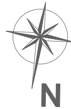
Plan de pré-commercialisation