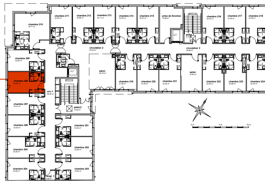
Plan de localisation R+2