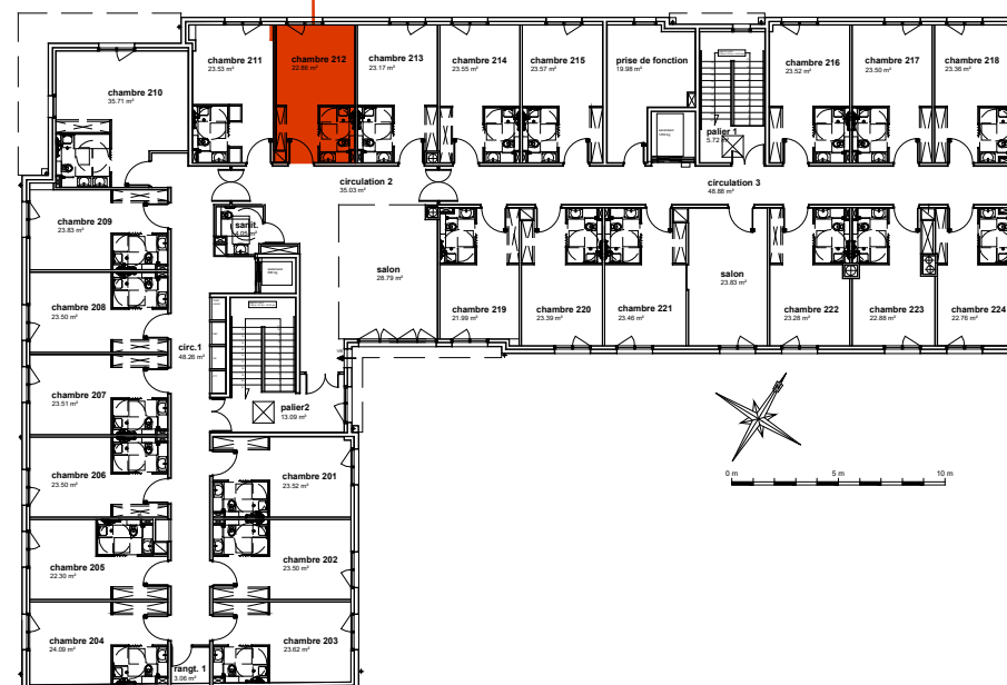
Plan de localisation R+2