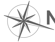
Plan de pré-commercialisation