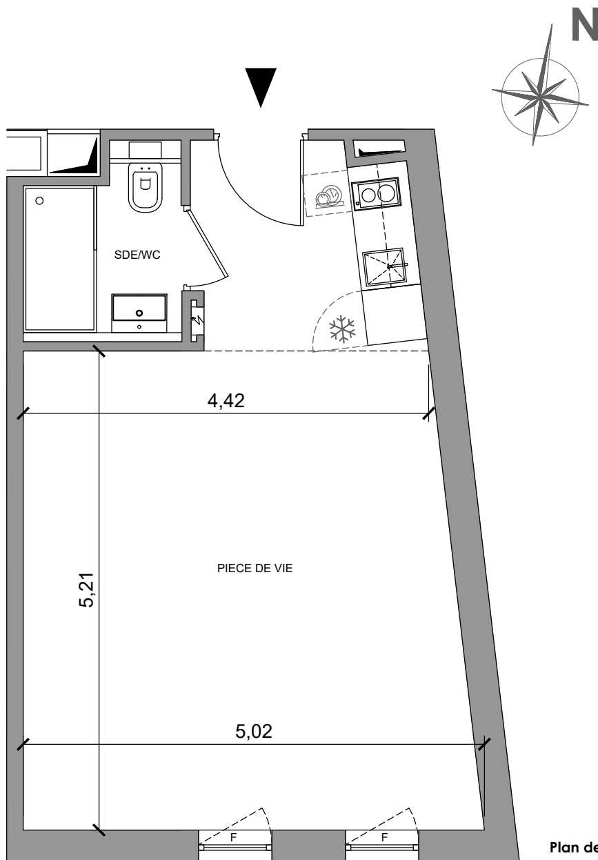
Plan de pré-commercialisation