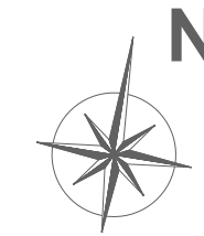
Plan de pré-commercialisation